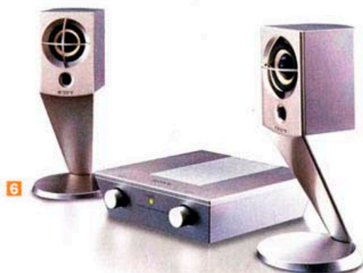
4 ソニー「マイファーストソニー」シリーズのデザインにも参加。その内の1つのウオーキートーキー 5 ソニー・フィールド。アウトドアユースを念頭にデザインされたラジカセ 6 ソニーのPC用のアクティブスピーカー。不要な音の反射を避け、ピュアな音の再現をテーマに開発したデザイン

逃げていた香港ではなく深圳に出張所を設置したのは、賃料や人件費が香港に比べ安かったからである。